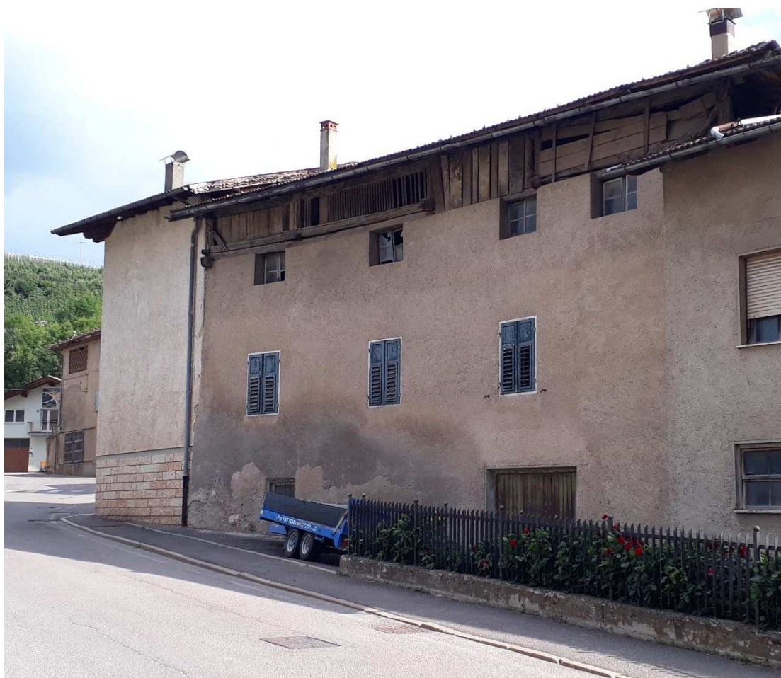
Vista da nord